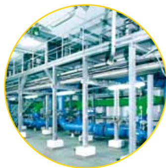
Rohrleitungsbau einer Trinkwasser-Aufbereitungsanlage aus Stahl (ZM-Auskleidung) und Edelstahl (Werkstoff-Nr. 1.4571).

Außerdem führen wir Dichtigkeitsüberprüfungen für Gas-, Acetylen-, Sauerstoff- und Pressluftleitungen sowie aller anderen Medien durch. Parallel dazu bieten wir auch eine Bestandsaufnahme aller Leitungen inklusive einer Dokumentation im CAD-System an.