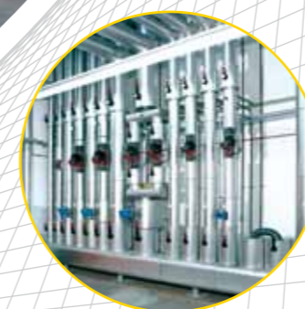
Kompaktkammerverteiler aus kombiniertem Vor- und Rücklauf- verteiler mit sieben Abgängen.