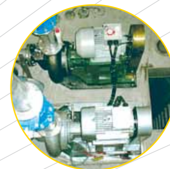
Edelstahlpumpwerk mit Rohrleitungen aus Duplexstahl