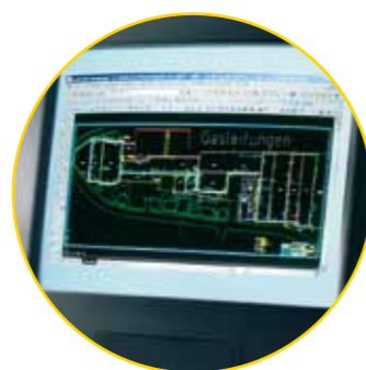
Leitungsdokumentation im CAD-System.