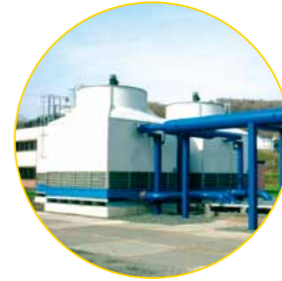
Kühlturm für die eisenschaffende Industrie mit einer Leistung von rund 2500 m 3 pro Stunde im Durchsatz.

Das Besondere hinterlässt Spuren. In jeder Epoche aufs Neue.