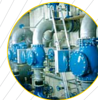
Pumpwerk, vier Pumpen à 600 kW